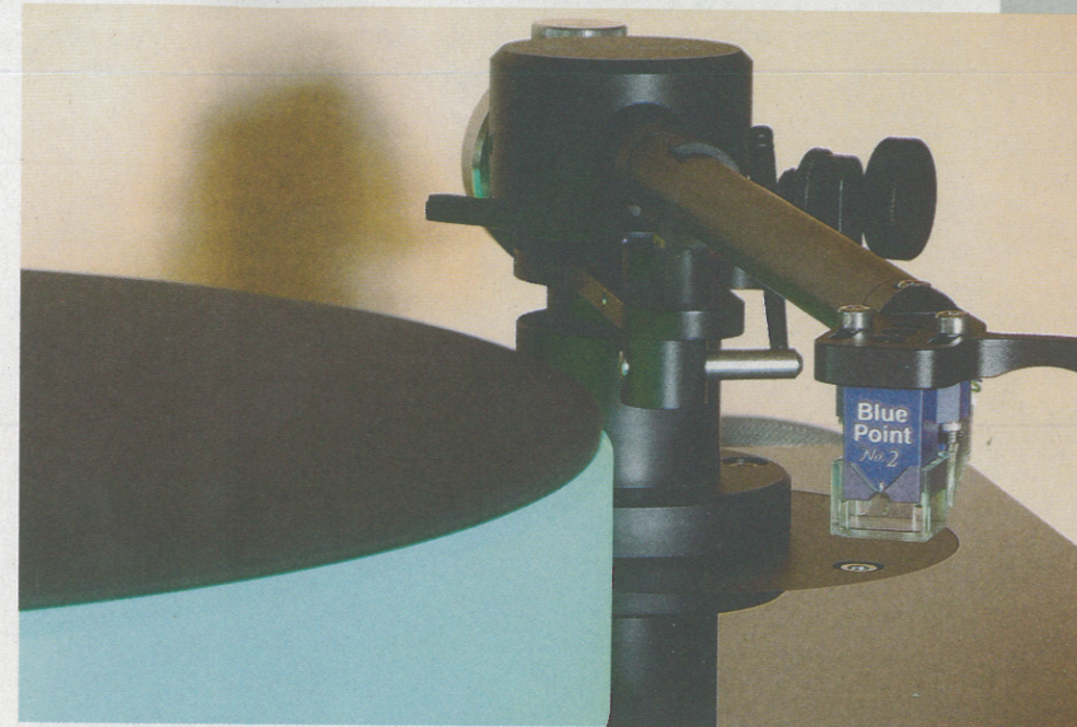
La testina MC ad alta uscita è ottimizzata per l'accoppiamento diretto con l'ingresso MM degli amplificatori integrati e pre McIntosh.

Il momento magico, tuttavia, non manca quando accendo il McIntosh e il grosso piatto in acrilico semitrasparente si illumina di un delizioso ed inimitabile verde-azzurro. Non servono spie o LED, quando si accende, si accende tutto. L'MT5 gestisce tre velocità di rotazione: 33, 45 e 78 giri. La stabilità è assicurata da un motore di costruzione svizzera che impiega due magneti in neodimio in opposizione, il tutto inserito in un telaio solido ed inerte dotato di piedini regolabili per la perfetta riuscita